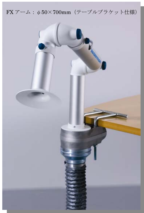
FXアーム：φ50×700mm（テーブルブラケット仕様）